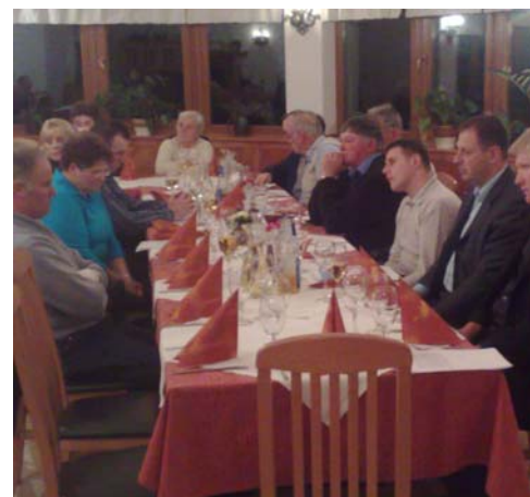
Uradni del so člani in simpatizerji OO SLS Kamnik prijetnim pogovorom.