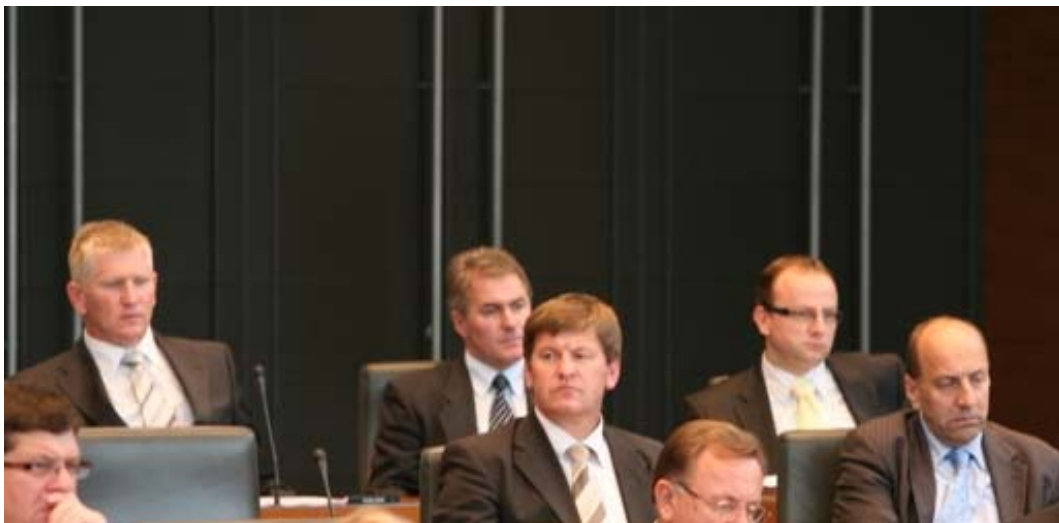
Poslanska skupina SLS