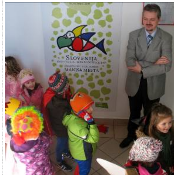
Župan občine Pivka si je ogledal tudi šjeme v košanski osnovni šoli.