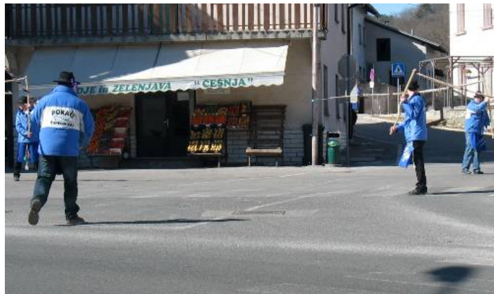
Na povorki v mestu Pivka so sodelovali tudi pokači iz Župečke vasi.