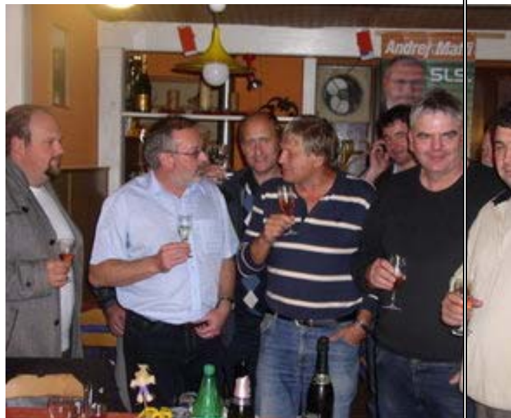
Kanal ob Soči