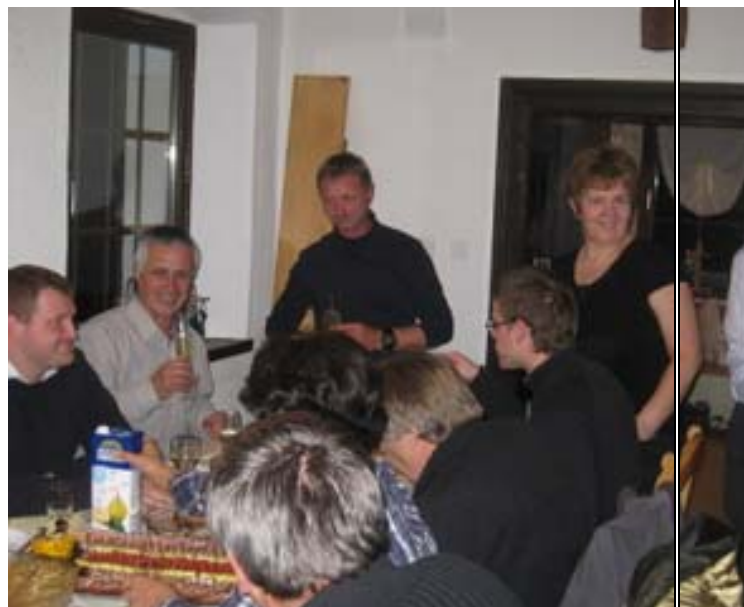
Smarno ob Paki