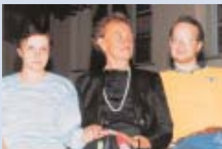
"Z malimi vitezi"

bolj vem, kako prav smo imeli v Upokojenski zvezi že več kot pred desetletjem.