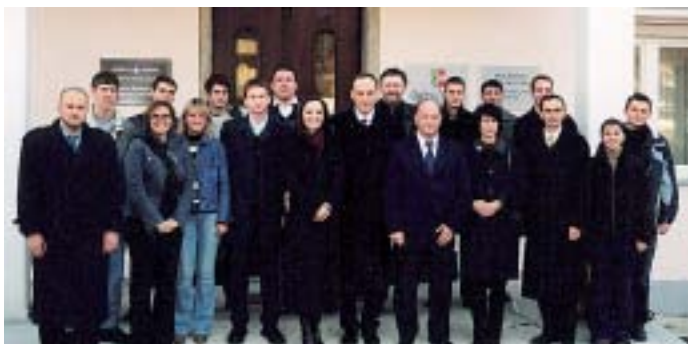
Janez Podobnik predsednik Slovenske ljudske stranke