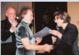
Podelitev priznanja ljudje odprtih rok

Seveda, saj me je vodstvo onkološkega inštituta postavilo na hodnik, kjer naj (zastonj) delam, ministrstvo za znanost pa mi skuša, tudi v nasprotju z zakonom, preprečiti raziskovalno delo. Morda to ni pravi pomen besede upokojitev, ampak tako sem jo doživela. Seveda me tudi nihče ni vprašal, če hočem v pokoj. V Slovenski ljudski stranki sem vrsto let vodila Upokojensko zvezo, kjer smo skušali doseči, da bi bilo upokojevanje bolj civilizirano, manj birokratsko, bolj v skladu z željami in potrebami obeh partnerjev in bi tako država lahko izkoristila še mnogo tistega, kar starejši znano in lahko nudimo. Nekaj malega smo v novem zakonu že dosegli, izgleda pa, da še nismo premaknili birokratske miselnosti, ki jo velikokrat občutim tudi na svoji koži. Danes se