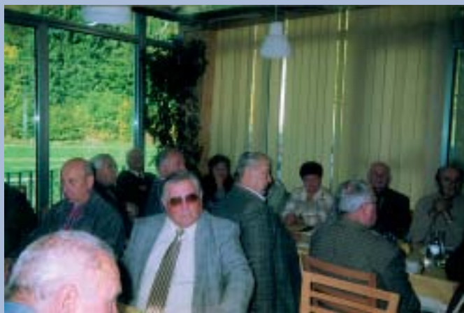
Upravni odbor Zveze upokojencev na 8. seji 27. oktobra letos.