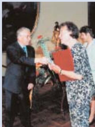
Ambasador znanosti 1997