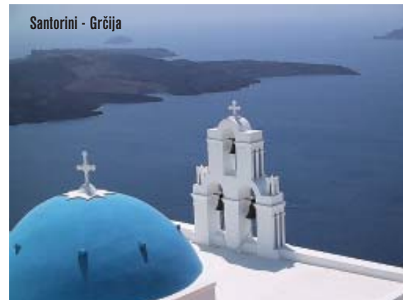
Santorini - Grčija