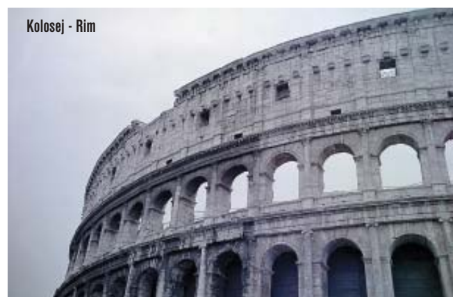
Kolosej - Rim

Na tak način bodo poslanci iz vrst SLS v okviru Evropskega parlamenta v polnosti zastopali slovenske državljane in državljanke ter pripomogli k uspešni Sloveniji v močni Evropi.