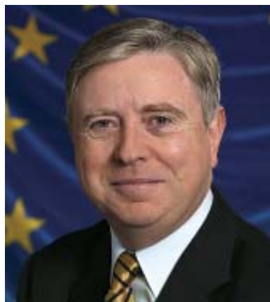
Pat Cox - predsednik Evropskega parlamenta

Predsednik Evropskega parlamenta je še zadnjič nagovoril poslance. V uvodu je izrazil zadovoljstvo nad delom parlamentarnih odborov, s katerim so pripomogli k dejstvu, da se je Parlament izkazal kot zanesljiv partner Svetu EU in Komisiji.