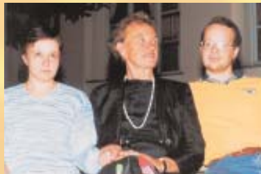
»Z malimi vitezi«