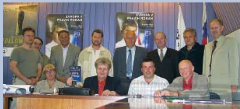
Člani MO SLS Novo mesto.