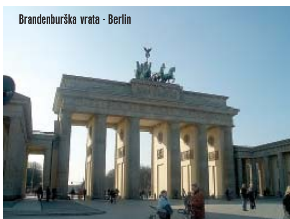
Brandenburška vrata - Berlin