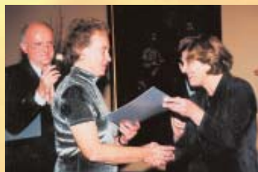
Podelitev priznanja ljudje odprih rok