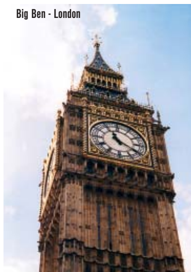
Big Ben - London