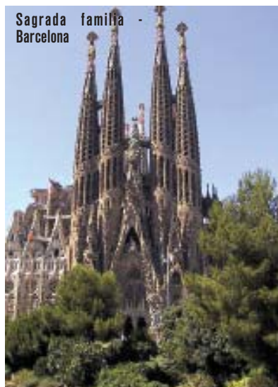
Sagrada familia - Barcelona