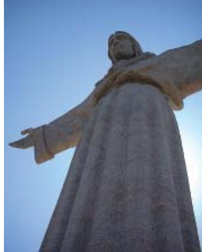
Jezus - Lizbona

viti brezskrbna zrela leta s stabilnim pokojninskim sistemom in povečano skrbjo za starostnike, ki potrebujejo pomoč, zato si bomo še posebej prizadevali urediti pogoje, ki bodo to omogočali.