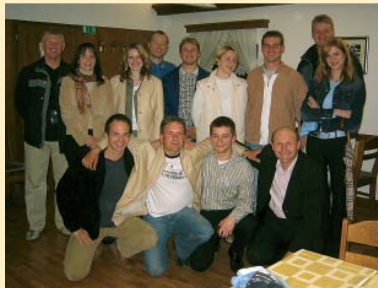
Občni zbor Nove generacije SLS v Litiji