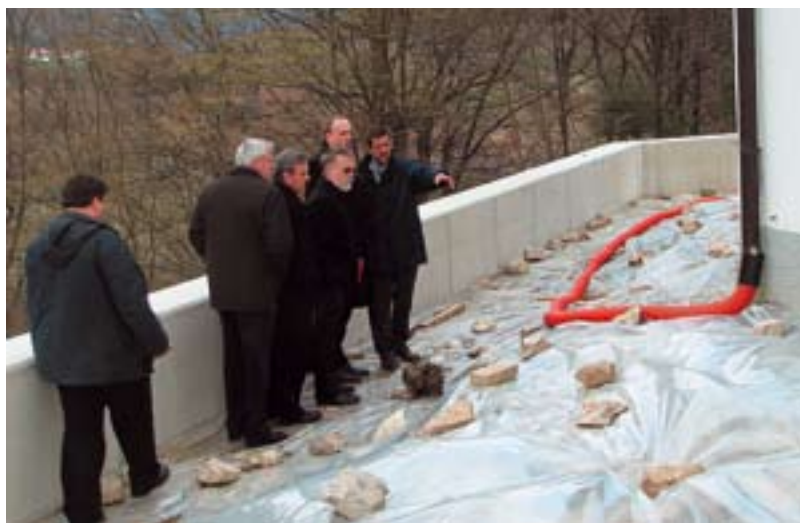
Minister Janez Podobnik ob obisku Vlade Republike Slovenije v Slovenski Istri in Krasu