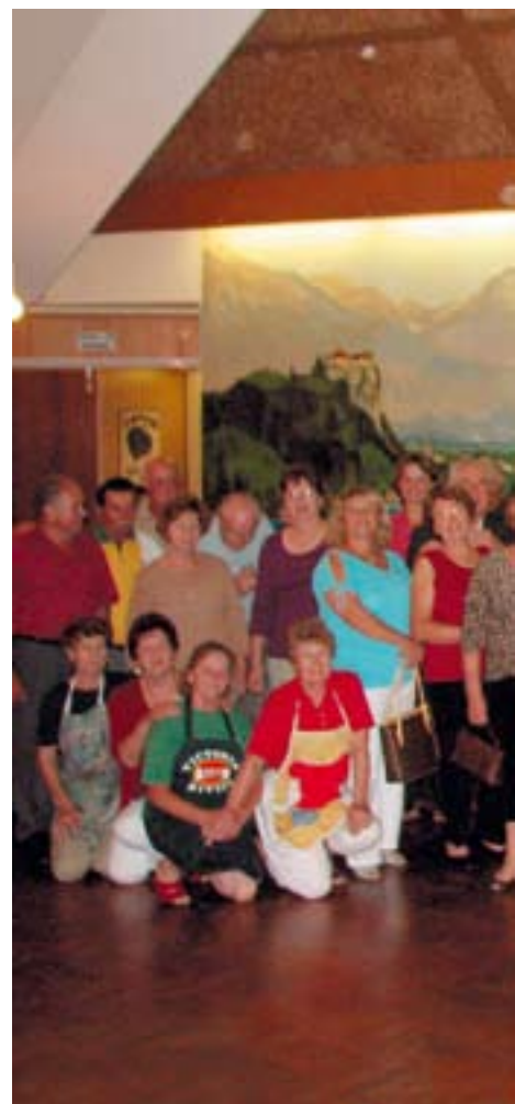
Delegacijo je vodil poslanec SLS v DZ RS