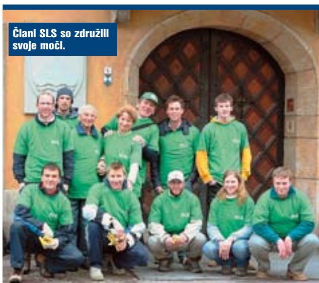
Člani SLS so združili svoje moči.