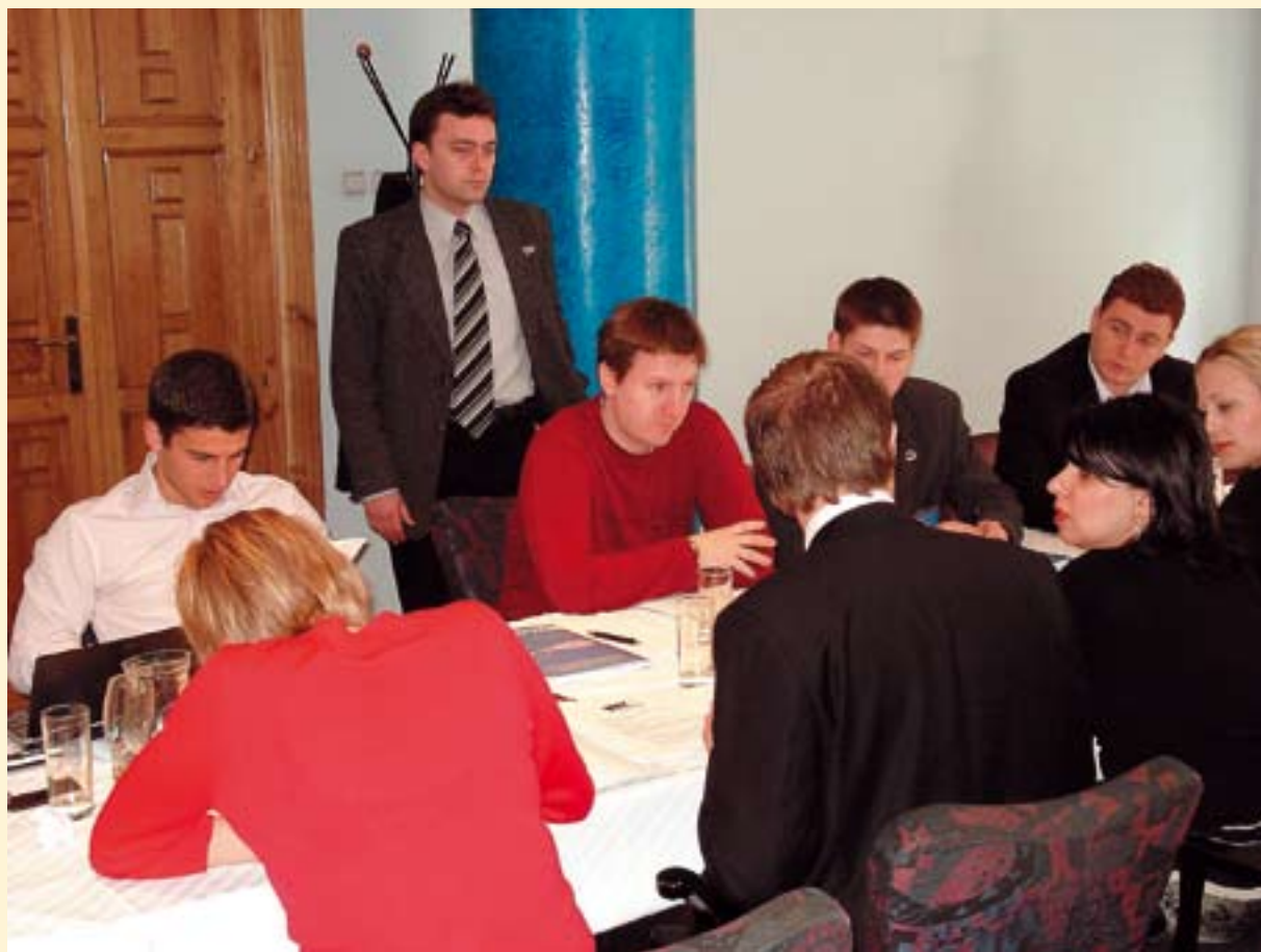
Ure za izobraževalni seminar

V soboto smo že zgodaj zjutraj pričeli s predavanji. Predavatelji so bili svetovalci predsednika vlade, varuh človekovih pravic, minister znanosti