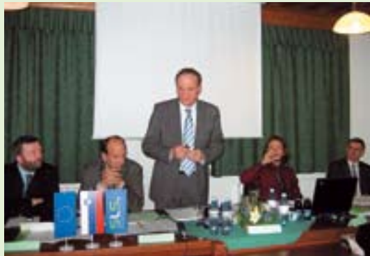
Delo ministrstva za okolje in prostor v okviru 5. volilne enote je predstavil minister in predsednik SLS Janez Podobnik