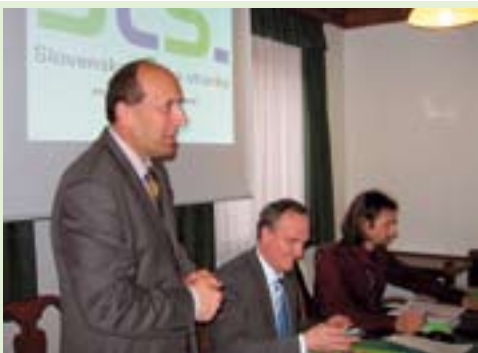
Prisotne na srečanju 5. volilne enote je pozdravil nosilec volilne enote, vodja poslanske skupine SLS Jakob Presečnik