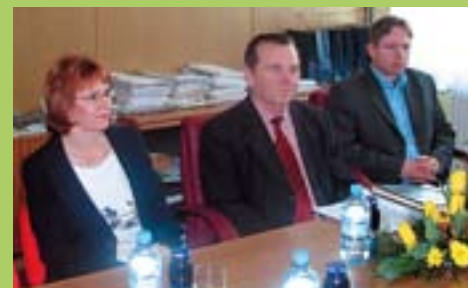
V Lenartu je minister obiskal podjetje Lenthalm Invest, d.o.o.