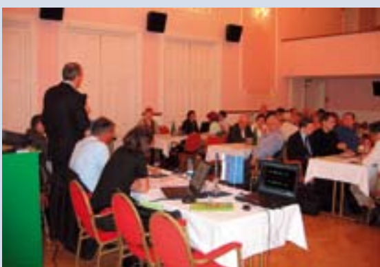
Udeleženci srečanja na ravni 6. volilne enote so se po predstavitvi tem tudi sami vključili v razpravo