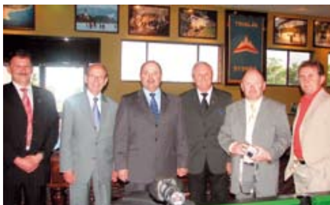
Na obisku pri izseljencih v Avstraliji

se potomci slovenskih izseljencev pravočasno izrekli za pridobitev slovenskega državljanstva. Že Temeljna ustavna listina o samostojnosti in neodvisnosti Republike Slovenije izhaja iz dejstva, da SFRJ ni delovala kot pravno urejena država in da so se v njej hudo kršile človekove in nacionalne pravice; mnoge izmed kršitev so doživeli tudi slovenski izseljenci, ki so svoje izkušnje posredovali na svoje potomce. Le ti