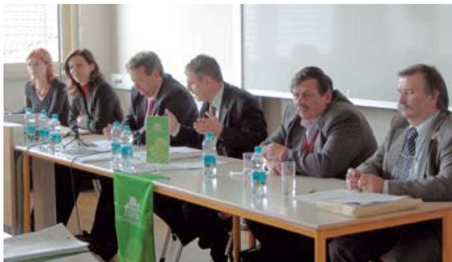
Seje sveta se je udeležil tudi kmetijski minister Iztok Jarc , ki je predstavil aktivnosti ministrstva in odgovarjal na vprašanja svetnikov.