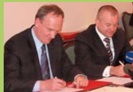
Na Mestni občini Maribor podpisal dve pismi o nameri, in sicer za sodelovanje pri pripravi in izvedbi projekta sanacije odlagališča Bohova in Studenci ter o ustanovitvi Pilotnega centra v Mariboru za upravljanje s porečjem reke Drave.