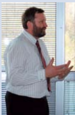
Delo Službe Vlade RS za lokalno samoupravo in regionalno politiko je predstavil minister dr. Ivan Žagar