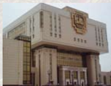
Nova knjižnica Univerze Lomonosov, v kateri je bilo predavanje

Rusija bo potrebovala pomoč pri pripravi in implementaciji zakonodaje s področja kemikalij. Vloga Medvladnega foruma pri promoviranju