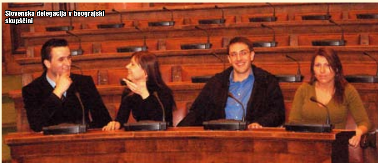
Slovenska delegacija v beograjski skupščini

kjer so vsi predstavniki držav podali poročilo o delovanju podmladkov in političnem stanju v njihovi državi. Na zadnjo večerjo so nas gostitelji odpeljali v najbolj znano beograjsko restavracijo »Dva Jelena«. Večerja je bila namenjena še zadnjim predstavitev udeležencev, saj se je morala vsaka država udeleženka predstaviti še s pesmijo in petjem, če jim je le ostalo še kaj glasu. Ob dobri hrani in pijači se je razvila še interna debata