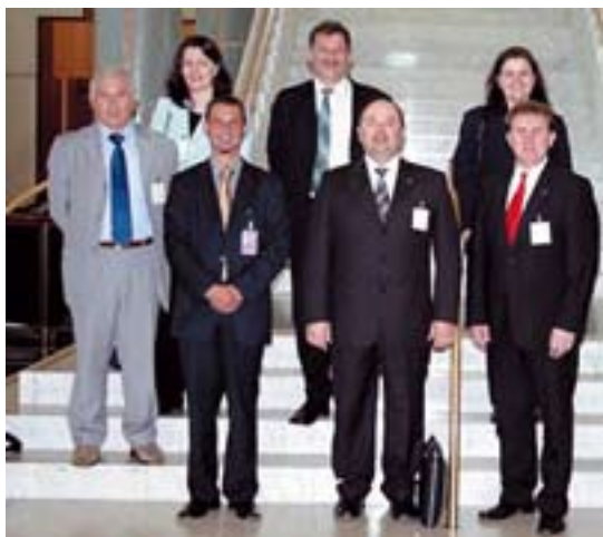
Slovenska delegacija na obisku v Avstraliji