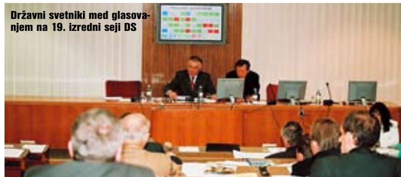
Državni svetniki med glasovanjem na 19. izredni seji DS

Državni svet Republike Slovenije je izglasoval odločilni veto na Zakon o spremembi in dopolnitvi Obligacijskega zakonika, ki ga je Državni zbor Republike Slovenije sprejel 30. marca oziroma je sprejel zahtevo, da Državni zbor Republike Slovenije ponovno odloča o Zakonu o spremembi in dopolnitvi Obligacijskega zakonika.