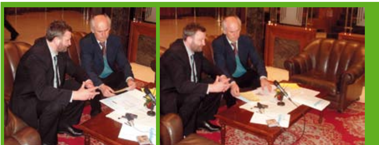
Vlada RS je v mesecu marcu obiskala Slovensko Istro in Kras. Ob tej priložnosti se je minister, pristojen za področje lokalne samouprave in regionalne politike, dr. Ivan Žagar, v Portorožu srečal s predstavniki medijev in se z njimi pogovarjal o predlogu pokrajinske zakonodaje in odgovarjal na njihova vprašanja.

Ob pripravi regionalnih razvojnih programov za obdobje 2007-2013 so bile vse slovenske obmejne regije pozvane, da posebno pozornost posvetijo projektom čezmejnega sodelovanja. Ob tem je Služba Vlade RS za lokalno samoupravo in regionalno politiko (SVLR) v postopek priprave Operativnega programa za Cilj 3 Slovenija Avstrija, ki je bil uspešno zaključen in čaka le na potrditev s strani Evropske komisije, vključila predstavnike razvojnih agencij in lokalnih skupnosti ob meji, pri delu programskih odborov pa so sodelovali tudi predstavniki Slovencev na Koroškem. Minister dr. Ivan Žagar je prepričan, da bodo na osnovi dosedanjih dobrih izkušenj pri izvajanju čezmejnih projektov na gospodarskem, socialnem, okoljskem in kulturnem področju, tudi v prihodnje omogočili vsem zainteresiranim podporo iz kohezijskih sredstev EU.