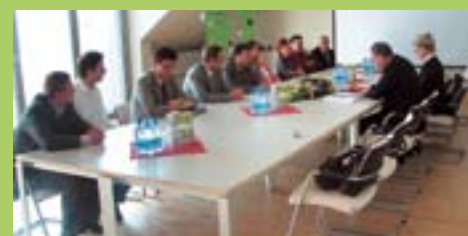
S predstavniki podjetja za projektiranje Urbis, d.o.o., v Mariboru.