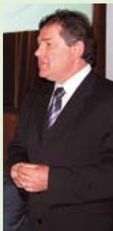
Delo ministrstva za promet v prvi volilni enoti je predstavil minister mag. Janez Božič