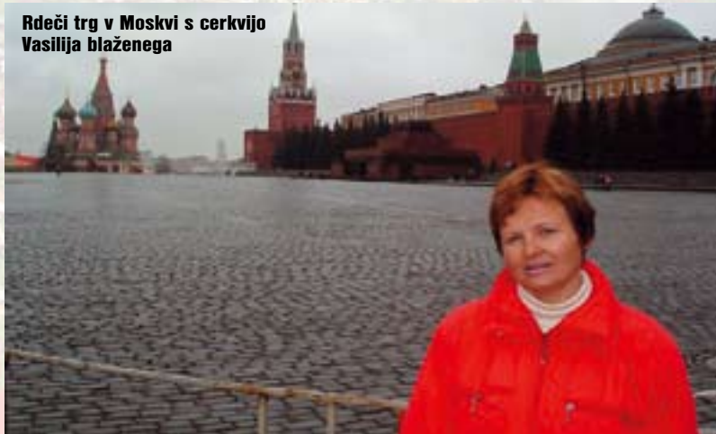
Rdeči trg v Moskvi s cerkvijo Vasilija blaženega

»ZVESTOBA v dobrem in slabem je vrednota tudi v politiki!«