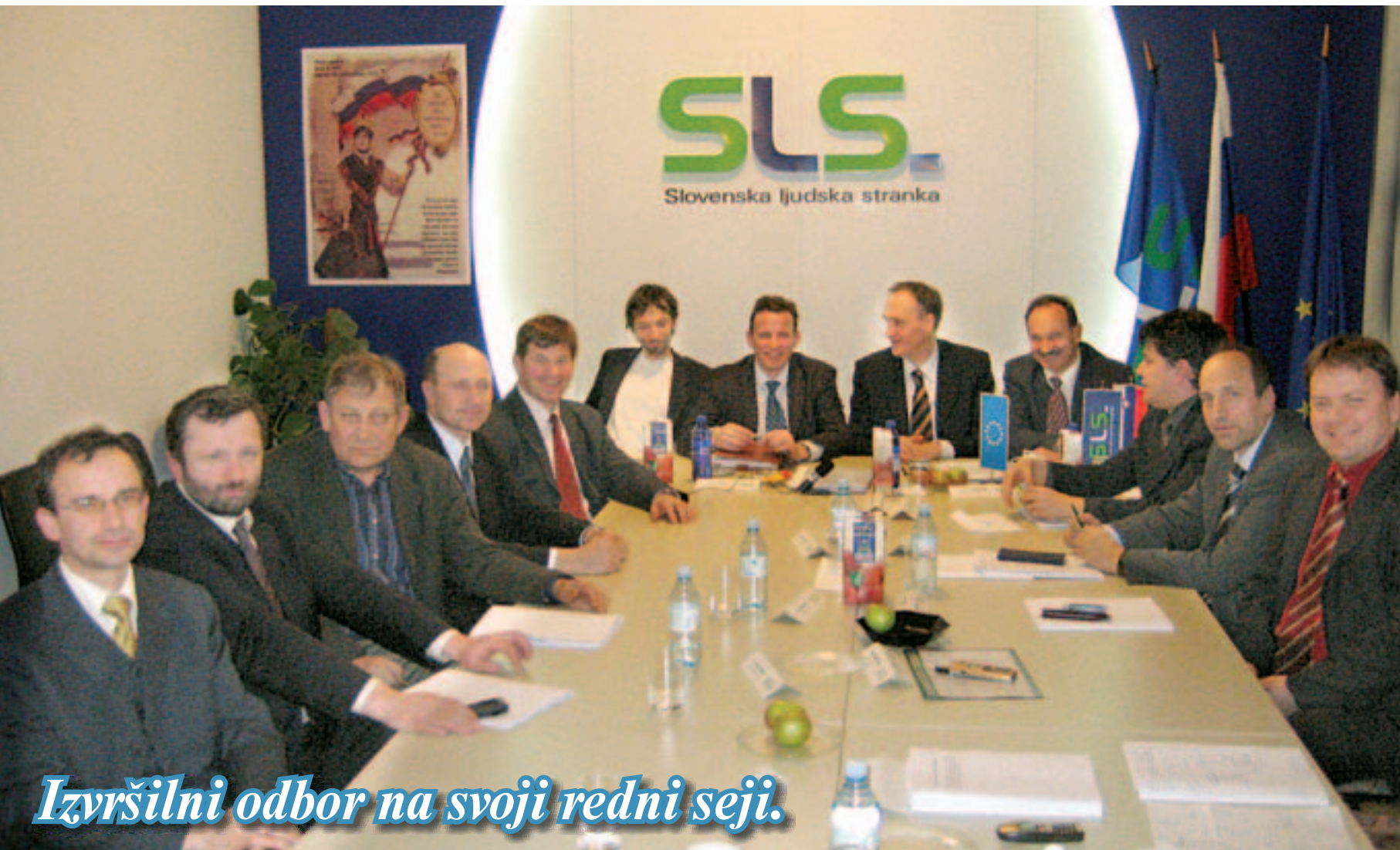
Izvršilni odbor na svoji redni seji.