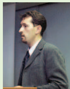
dr. Gregor Virant

Združenja občin Slovenije so ministru za javno upravo Gregorju Virantu med drugim predstavili problematiko plač županov in pripombe k zakonu o preprečevanju korupcije. Župani so namreč prepričani, da je sedanji sistem, ko je plača župana v občinah z največ