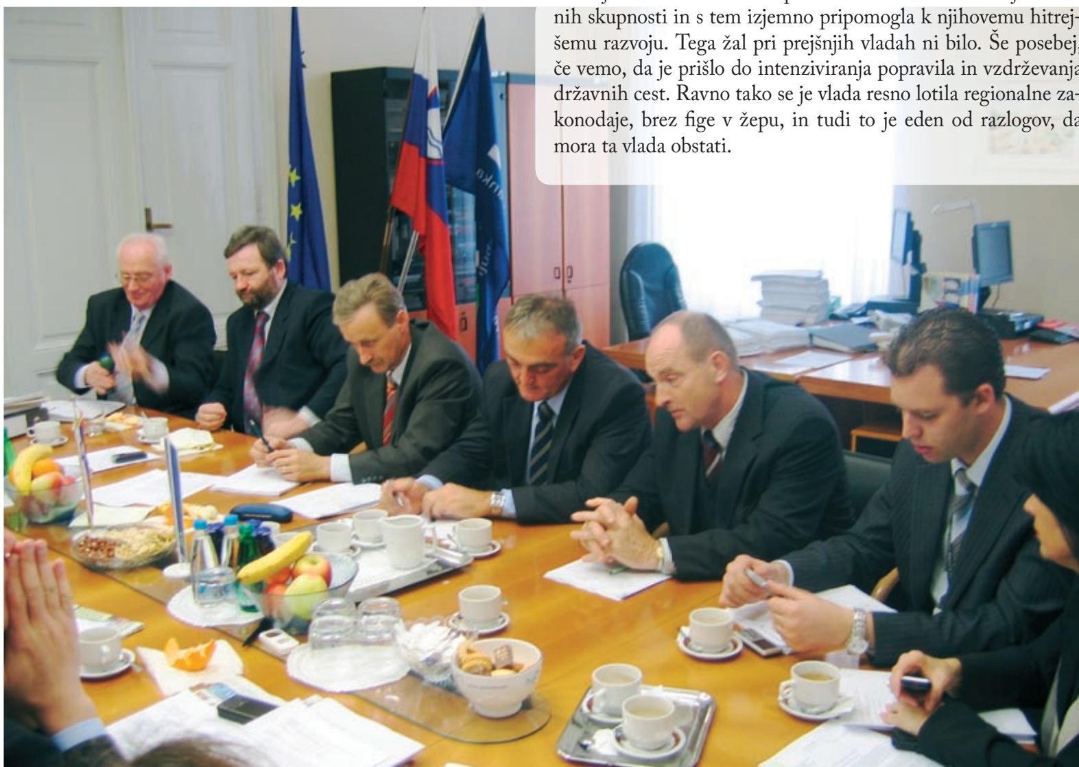
Seja poslanske skupine SLS.